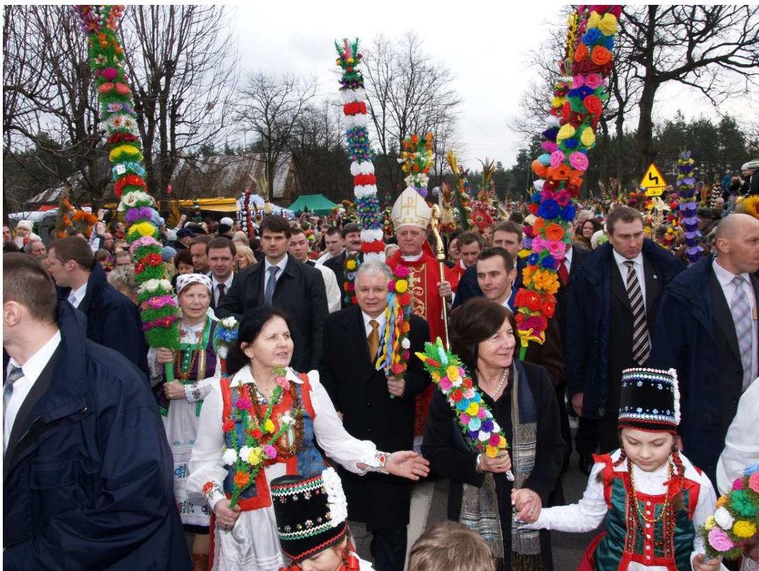
Fot. 1: Procesja z palmami.