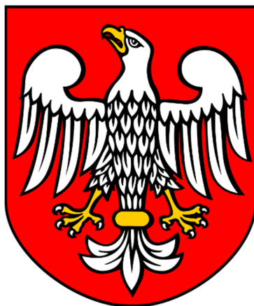
Rysunek 6: Herb województwa mazowieckiego 2002-2006 r. 34

Herb województwa mazowieckiego został przyjęty uchwałą Nr 50/02 Sejmiku Województwa Mazowieckiego z dnia 13 maja 2002 roku. Przedstawiał w polu czerwonym białego orła o dziobie i szponach złotych oraz złotym pierścieniu spinającym ogon.