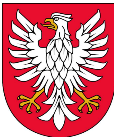
Rysunek 7: Herb województwa mazowieckiego od 2006 r. 35

W 2006 roku herb ten zakwestionowała działająca przy Ministerstwie Spraw Wewnętrznych i Administracji Komisja Heraldyczna. Uchwałą Sejmiku Województwa Mazowieckiego z dnia 29 maja 2006 roku herb został zmieniony. Nowy wzorowany jest na historycznym herbie książąt mazowieckich z dynastii Piastów, w wersji używanej przez 200 lat od momentu inkorporacji Mazowsza do Korony, aż do III rozbioru Polski. Jest jego współczesną interpretacją, a nie wierną kopią.