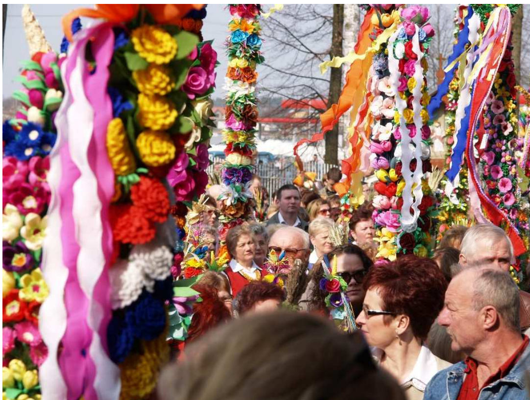
Fot. 2: Procesja z palmami.