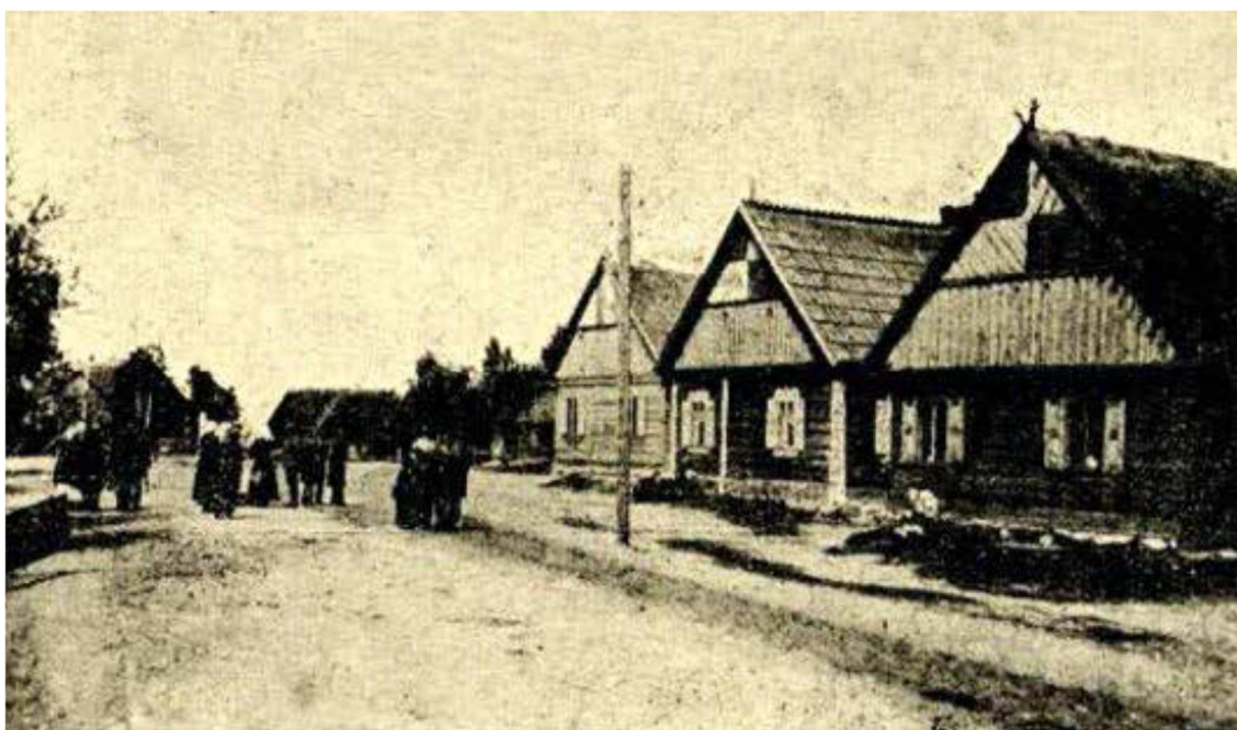
Fot. 5: Wieś kurpiowska Łyse (pow. Kolno) widok ogólny.