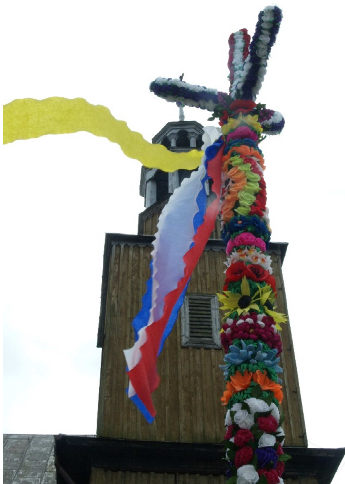
Fot. 4: Palma kurpiowska.

wspierają także twórcy ludowi zrzeszeni w Oddziale Kurpiowskim Stowarzyszenia Twórców Ludowych.