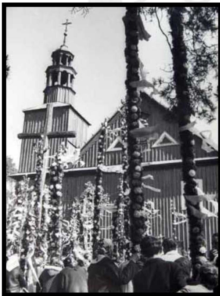
Fot. 3: Przed procesją w Niedzielę Palmową 1974 r.