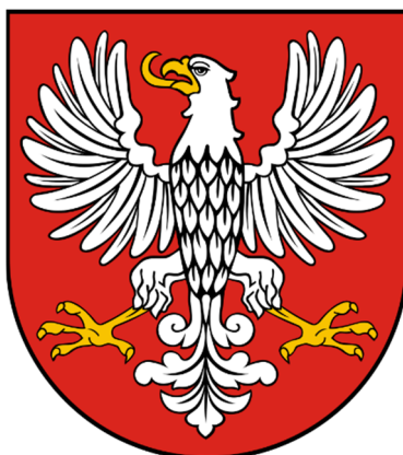
Rysunek 5: Herb województwa warszawskiego II RP 33

Herb województwa warszawskiego: Orzeł biały bez korony, zwrócony w prawo w polu czerwonym (typ orła z czasów Zygmunta III - bez snopka Wazów).