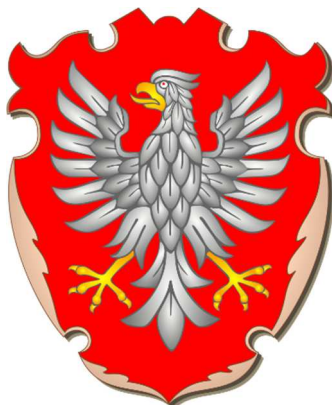
Rysunek 3: Współczesna rekonstrukcja herbu województwa mazowieckiego 31

Księstwo, a później województwo mazowieckie używało herbu przedstawiającego w polu czerwonym orła srebrnego z orężem złotym. Mniejsze jednostki podziału administracyjnego I Rzeczypospolitej zazwyczaj herbów nie posiadały.