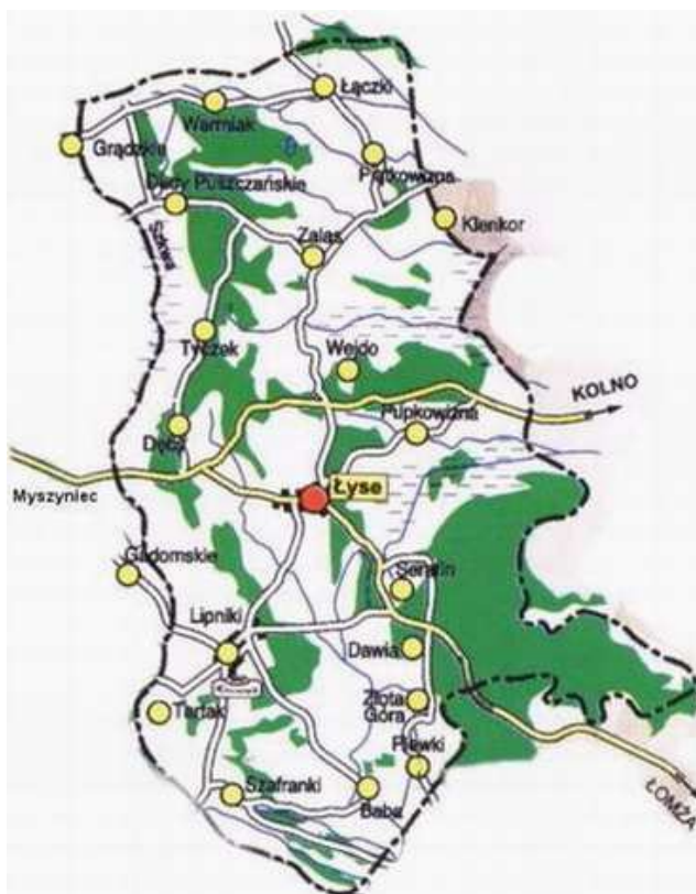
Rysunek1: Mapa Gminy Łyse

Ziemia jest tu słaba, gdyż gmina położona jest na sandrach (piaskach) naniesionych przez ostatnie zlodowacenie bałtyckie. Ten sam lodowiec wyrzeźbił krajobraz sąsiednich Mazur. Gleby są w przeważającej mierze klas V, VI i VI RZ (pod zalesienie). Łąki i pastwiska stanowią tu podstawę rolnictwa.